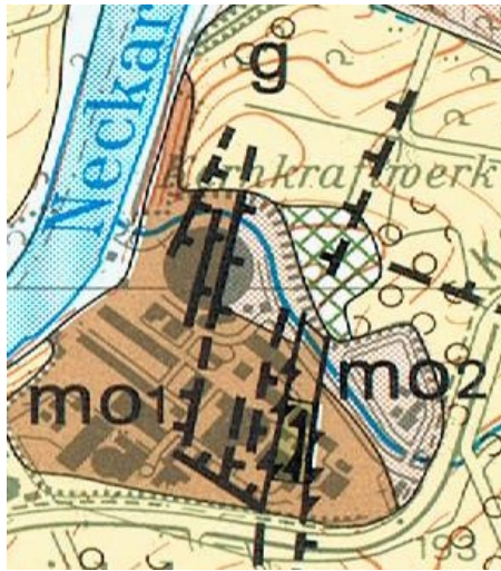
Landesamt f. Geologie, Rohstoffe u. Bergbau Geologische Karte Blatt 6921 Großbottwar Aufnahme 1980-81 1: 25 000 Ergänzungen 2000 Geologische Karte 1: 50 000 Blatt Heilbronn